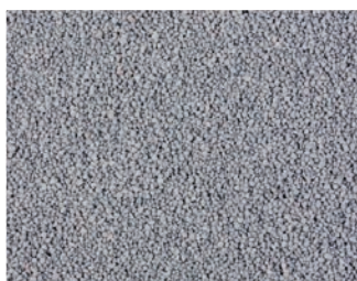
VH 3 Серый