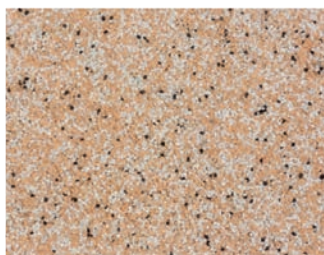
VH MIX 470