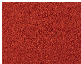
VH 50 Кирпично-красный

Оттенок акриловых и эпоксидных притирочных покрытий зависит от цвета применяемого песка-наполнителя. Наилучший декоративный и эксплуатационный эффект достигается при использовании смесей кварцевого песка (VH). Мы не рекомендуем к применению одноцветные пески для такого типа покрытий.