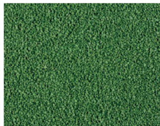
VH 11 Зеленый