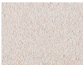
VH 1 Белый