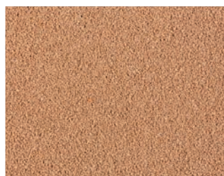
VH 4 Коричневый