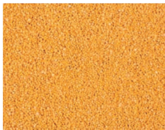
VH 5 Желтый