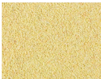
VH 40 Лимонно-желтый