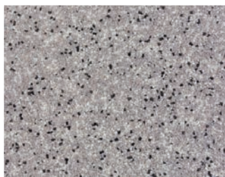
VH MIX 370

Оттенки песка-наполнителя для акриловых и эпоксидных высоконаполненных и притирочных покрытий