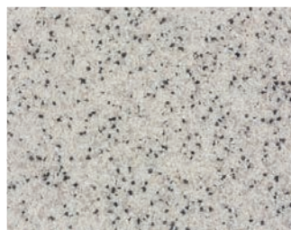
VH MIX 170